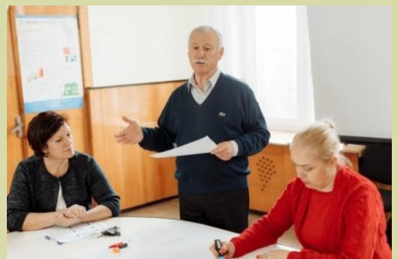
Fig.1. Președintele Comitetului Coordonator din or. Sîngerei

Bunăstarea și participarea socială a vârstnicilor au o influență reciprocă: participarea și integrarea socială favorizează bunăstarea psihică și fizică a persoanelor în vârstă și bunăstarea persoanelor în vârstă crește probabilitatea de a stimula participarea socială la o vârstă înaintată.