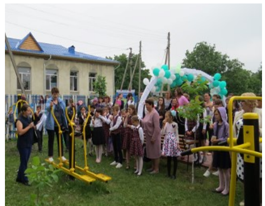
Fig.9. Zonă de odihnă pentru copii și vârstnici din s. Olișcani, rn. Șoldănești