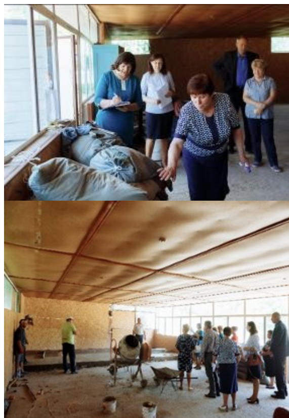
Fig.2-3. Monitorizarea lucrărilor de reparație a căminului cultural din com. Văscăuți, rn. Florești, efectuată de către membrii Comitetului Coordonator

Monitorizarea eficientă și intervenirea la timp cu sfaturi utile din partea membrilor comitetului vor contribui la redresarea unor situații neplăcute apărute pe parcursul desfășurării activităților și vor asigura realizarea cu succes a activităților preconizate în planul de acțiune privind componenta „Comunitate prietenoasă vârstei”.