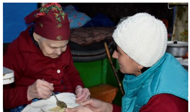
Fig.13. Acordarea serviciului de îngrijire socială la domiciliu

Ținând cont de aceste provocări, au fost dezvoltate servicii socio-mediceale de îngrijiri la domiciliu, au fost desfășurate lecții de sănătate.