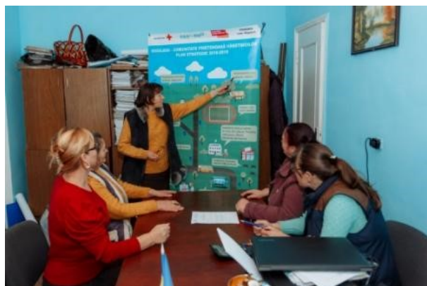
Fig.6. Evaluarea Planului de acțiune, com. Rogojeni, rn. Șoldănești

Membrii comitetului vor asigura prezentarea rezultatelor evaluării în cadrul unei reuniuni publice, pentru părțile interesate. După care, se va relua procesul de evaluare a problemelor/nevoilor vârstnicilor din comunitate.