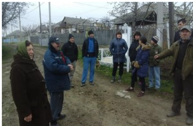
Fig. 16. Întâlnirea Ambasadorului Comunitar cu locuitorii din mahala, s .Cobîlea, rn. Șoldănești

Ambasadorii au fost abilitați să discute cu vecinii despre beneficiile conceptului de Comunitate prietenoasă vârstei, să organizeze campanii de informare și mobilizare a cetățenilor.