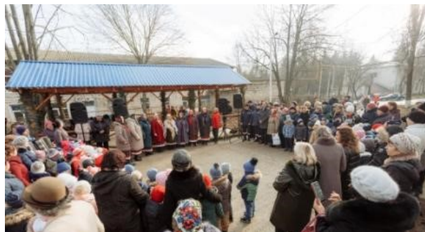
Fig.4. Lansarea foisorului, or. Rezina

Niciodată nu subestimați "puterea" celebrării succesului!