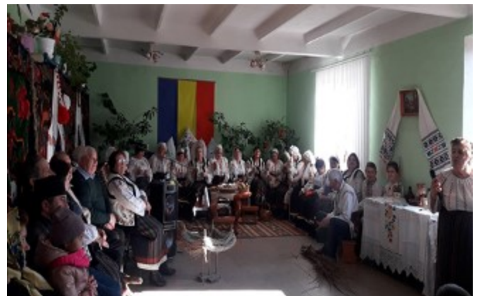
Fig.10. O șezătoare organizată

Șezătoarele în cadrul cărora vârstnicii le povestesc nepoților de timpurile și obiceiurile când aceștia erau tineri sunt de nelipsit. Aici bunicii învață generația tânără diferite jocuri pe care le practicau ei în copilărie, colinde vechi care se cântă la sărbătorile de Crăciun și Paște, le vorbesc despre obiceiuri și tradiții ce trebuie respectate și transmise din generație în generație.