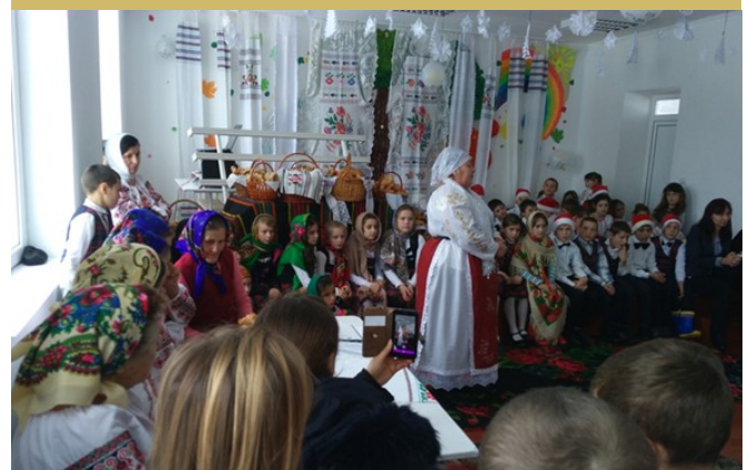
Fig.11. O șezătoare organizată