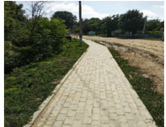
Fig.7. Trotuare construite în s. Cușmirca, rn. Șoldănești