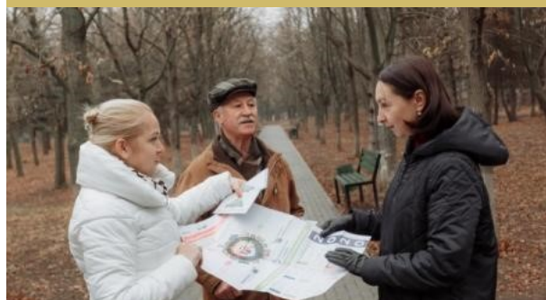
Fig.5. Informarea cetățenilor în or. Singerei