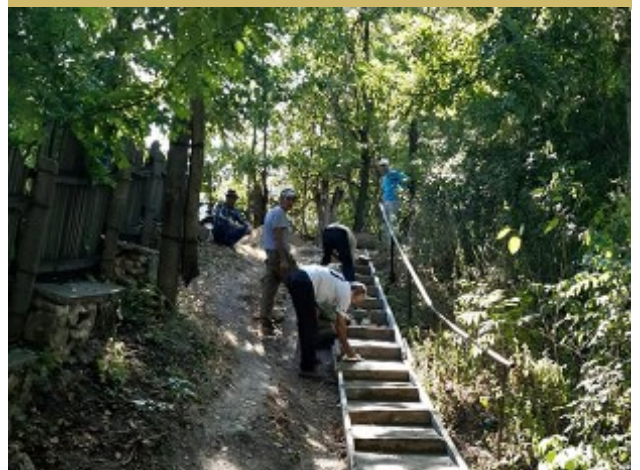
Fig. 19. Construcția treptelor pe panta spre piața locală