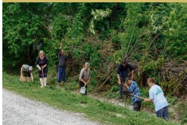
Fig.15. Ambasadorii Comunitari din com. Văscăuți, rn. Florești implicați în activități de salubritate a pădurii

„ Odată cu implementarea conceptului „Văscăuți – Comunitate prietenoasă vârstei”, instituirii Comitetului coordonator și a creării grupului de Ambasadori comunitari, s-au produs mari schimbări la nivel de comunitate. Comuna și-a schimbat aspectul la exterior, iar oamenii au devenit mai prietenoși, mai interesați de problemele comunității, vin cu soluții la problemele identificate, se implică activ în rezolvarea lor, a sporit interesul băștinașilor față de comunitate și activitățile desfășurate .”