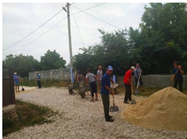
Fig.14. Mobilizarea cetățenilor din s. Echimăuți, r-ul Rezina

Echipa de Ambasadori participă la sesiuni de instruire pentru a învăța cum să identifice nevoile comunității, chestionează persoanele în etate, se consultă cu cetățenii și dezvoltă parteneriate în comunitate (grupuri de susținători).