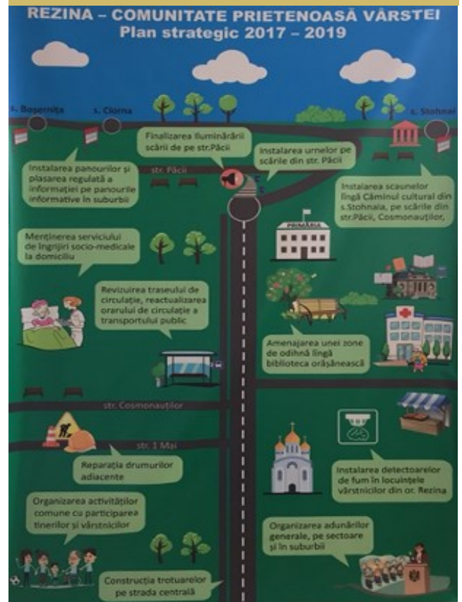
Fig.12. Planul de acțiune pentru orașul Rezina

Planurile de acțiune elaborate au fost reflectate în format grafic pe banere pentru a informa cetățenii despre acțiunile care se preconizează a fi realizate în fiecare comunitate.