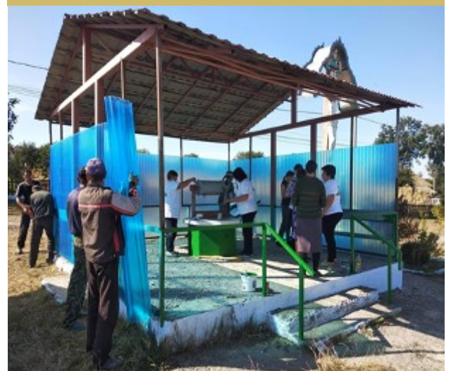
Fig.20. Amenajarea fântânii de la intrarea în sat de către Ambasadorii comunitari din s. Cobîlea, rn. Șoldănești