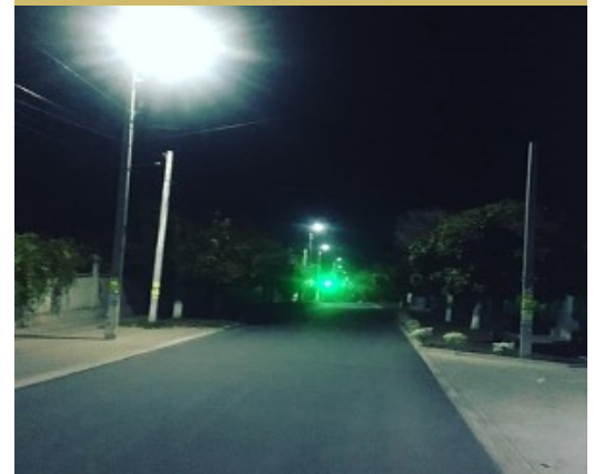
Fig.8. Reparația străzii și iluminarea acesteia în or. Șoldănești